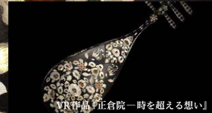
VR作品「正倉院 一時を超える想い」