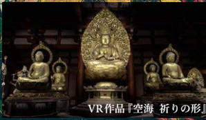
VR作品「空海 祈りの形」