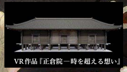
VR作品「正倉院 一時を超える想い」