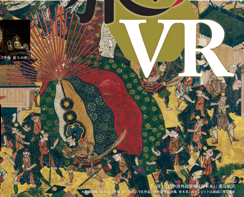
国宝「洛中洛外図屏風(舟木本)」部分拡大

*掲載画像 VR作品「空海 祈りの形」VR作品「洛中洛外図屏風 舟木本」のクレジットは裏面に準じます