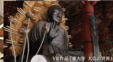
VR作品「東大寺 大仏の世界」