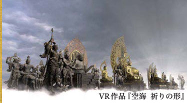
VR作品「空海 祈りの形」