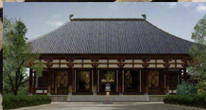
VR作品「鑑真和上がもたらしたもの 唐招提寺」